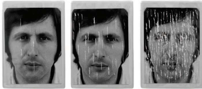
Autoanalisi, Self - Analysis, 1978

cambio di modalità operativa di Scabar: se fino a quel momento infatti l'artista si muove con riprese in esterno, prediligendo ampi spazi e la luce naturale – come nella serie dedicata a Trieste e ai manifesti pubblicitari – successivamente sono i dettagli “macro” ad attirare la sua attenzione. La sua produzione artistica si fa sempre più concettuale, arrivando a concentrarsi sul valore del “taglio” nella fotografia, inteso sia come inquadratura nel momento della ripresa sia come ritaglio materiale, a posteriori, della stampa fotografica.